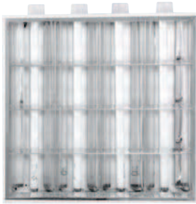
Front Apperance of GFAT-T8RS4 GFAT-T8RS4 Önden Görünümü