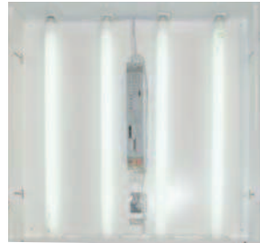
Electronic Ballast Version (Inner Apperance) Elektronik Balast Versiyonu (İç Görünüm)

Recessed fittings with aluminium reflectors, having single and double parabolic options, are mostly preferred in the offices or such places where people use computers. Thanks to its dedicated spring system, reflectors never hangs or falls from the body.