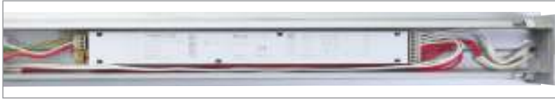
Inner Appearance GAP 080. GAP 080 İç Görünüm.