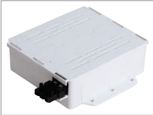
01 PLASTIC BOX PLASTİK KUTU