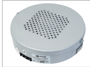
03 METAL BOX CIRCULAR METAL KUTU DAİRESEL